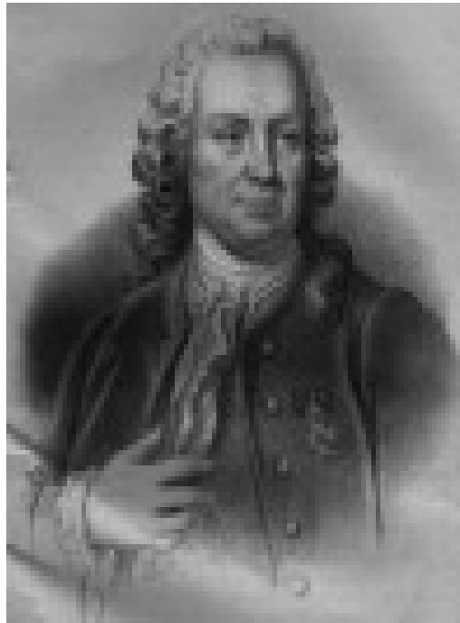
Till vänster: Omslaget till Roséns lärobok "Underrättelser om barnsjukdomar och deras botemedel" från 1764. Till Höger: Porträtt av Nils Rosén von Rosenstein, okänd målare.